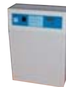
Coffret IP 20