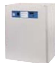
Coffret IP 31